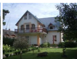
Gaestehaus „Misko Takas“