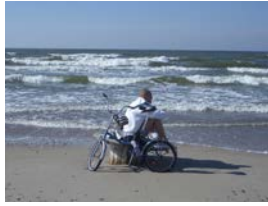
An der Ostsee