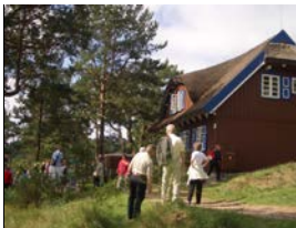
Thomas Mann Haus, Nida