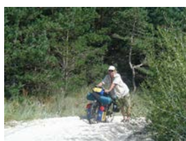
Durch die Duenen

Sie fahren auf dem gut ausgebauten Radwanderweg Nr. 1 an der Kueste entlang nach Sventoji, dem noerdlichsten Ferienort Litauens. Unterwegs passieren Sie die Orte Karkle und Nemirseta. Karkle, das ehemalige deutsche Karkelbek, hat einen einmalig schoenen Duenenfriedhof direkt an der Ostsee, Sie passieren Nemirseta, den ehemaligen Grenzort zwischen dem Deutschen Reich und Litauen und erreichen Palanga. Hier koennen Sie das weltgroesste Bernsteinmuseum besuchen, welches in der ehemaligen Sommerresidenz der Grafenfamilie Tiskevicius untergebracht ist. Das Schloss liegt in einem einzigartigen Botanischen Garten. Auf der Promeniermeile Palangas, der Basanavicius Allee lohnt sich eine Rast bevor es dann weiter entlang der Kueste , vorbei am Flughafen Palanga, nach Sventoji geht. Dort sind Sie untergebracht im Gaestehaus *** „Misko Takas“ Wegstrecke ca 50 km