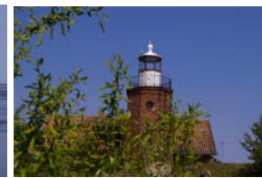
Leuchtturm von Vente