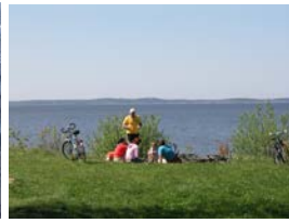
Blick zur Nehrung