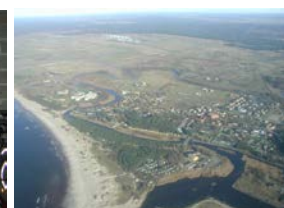
Auf Wiedersehen Litauen