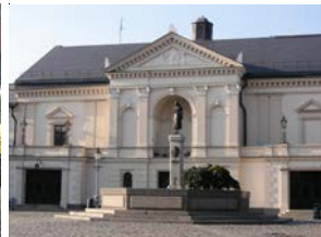
Aennchen von Tharau