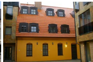
Hotel Euterpe, Klaipeda