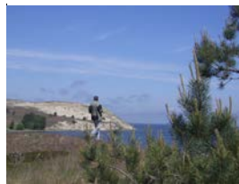
Auf der Nehrung