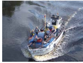
Fahrt uebers Haff