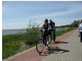
Radwanderweg Nr 10