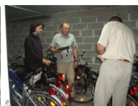
Abgabe der Fahrraeder