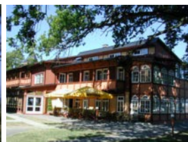
Hotel „Villa Flora“