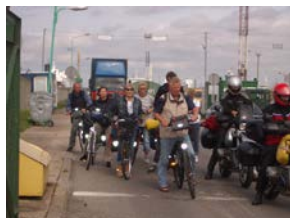
Ankunft in Klaipeda

Uebernachtung in Klaipeda, Hotel! **** „Euterpe“.