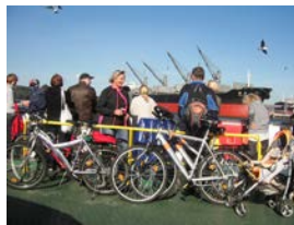
Faehre zur Nehrung