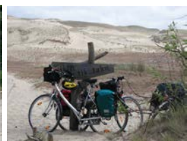
An den Grauen Duenen