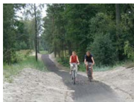
Auf dem Weg nach Nida